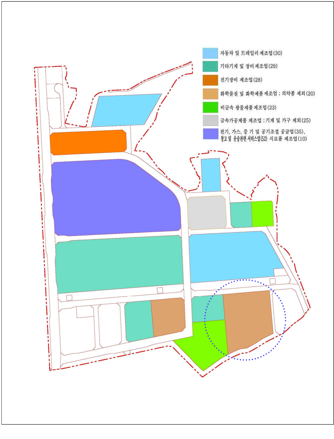
【별첨 2 : 업종별 공장 배치계획도】(변경)